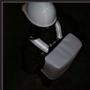
肩ベルト上部まで反射材を使用。上空ヘリからの発見に有効です。