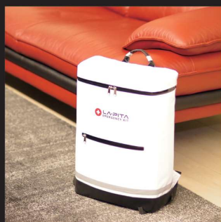
どんな場所にも素直に調和するデザイン。