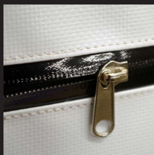
高品質な止水ファスナーを採用。雨水の侵入を防ぎます。